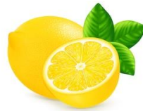
Raspa de um limão