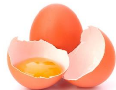
Gema de ovo para pincelar