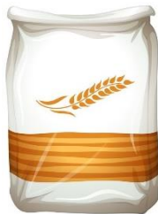
200 gr de farinha