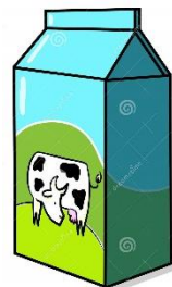
2 c. leite