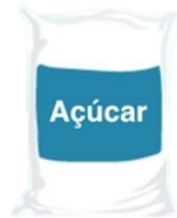
100 gr açúcar